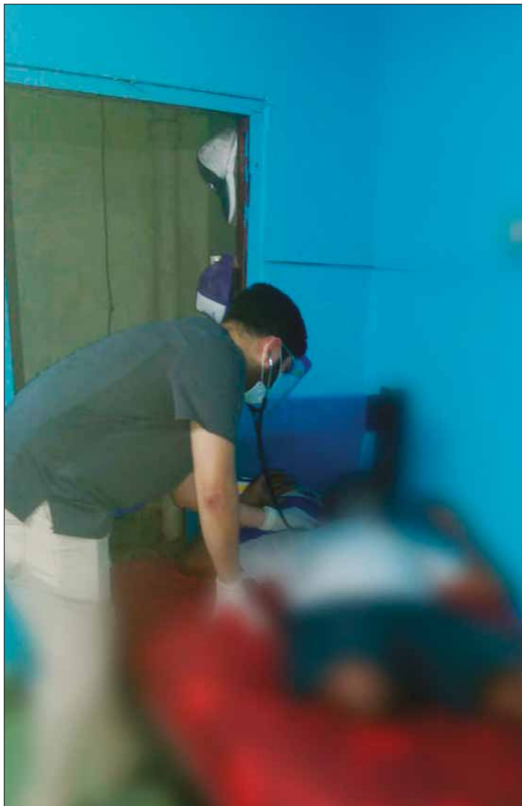
SALUD. El Mides ha gestionado la presencia de un médico que atiende a los residentes.

En este lugar reciben “los tres golpes” (desayuno, almuerzo y