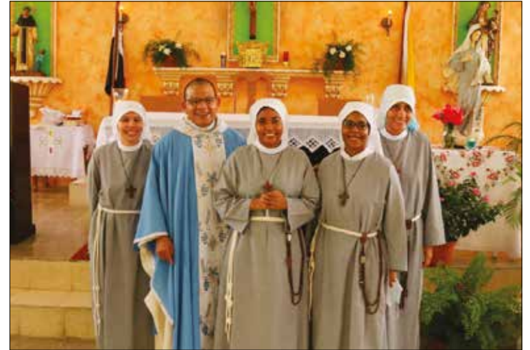
COMPROMISO. El 25 de junio hizo la profesión de los primeros votos.

universitarios, con tan solo 18 años, cuando les comunicó a sus padres, que definitivamente el Señor la estaba llamando a una gran experiencia y quería atreverse. La decisión los sorprendió, principalmente a su madre. Fue un momento fuerte y difícil dado que se iba sin la bendición de sus padres, pero muy convencida que, en su momento, serán tocados por Dios y le apoyarían.