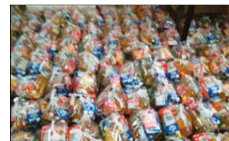
DONACIONES. Para familias pobres.

Adelantó que una las planificaciones es la ‘Comunión exprés’, que consiste en que las personas de la tercera edad, que por su condición deban ser acompañadas por familiares, puedan entrar y comulgar en áreas definidas para recibir el sacramento, en las cuales tendrán mayor accesibilidad.