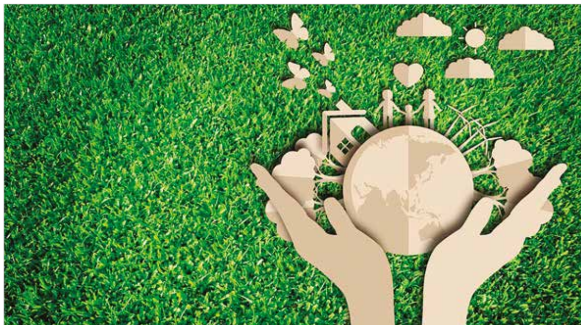
HUMANIDAD. El llamado urgente del Papa Francisco es salvaguardar la Casa Común.