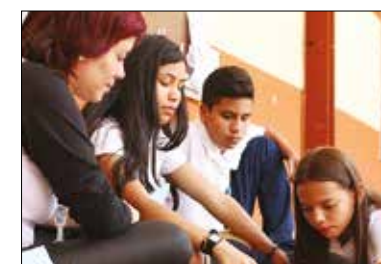
JÓVENES. Respetar sus identidades.

Durante la JMJ 2019, el Papa se reunió con jóvenes de Scholas de Panamá y Centroamérica. Un joven panameño de 17 años, estudiante de Scholas le pidió al Papa que abogase ante los gobernantes para que aprendan a escuchar a los jóvenes y respeten sus identidades, como se hace en Scholas: “Queremos una educación que no nos condene a ser empleados”.