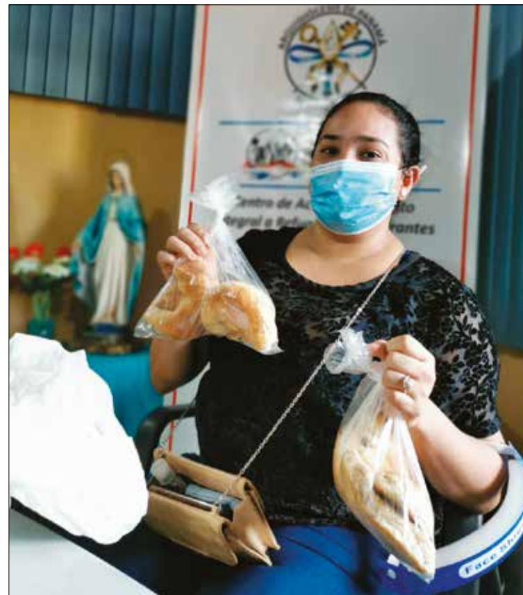
DONACIÓN. El Hogar Luisa benefició a 600 personas entre migrantes y refugiados.