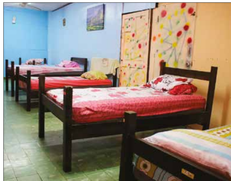
COMUNIDAD. Hay espacio para 30 residentes. Ya llegaron 28 de ellos.

Barrio Colón, frente al templo parroquial de la parroquia San Francisco de Paula.