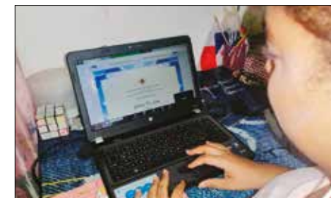
JÓVENES. Aprenden sobre emprendurismo.

El presbítero detalló que dicho comité está organizando grupos de trabajo, para poder atender las diferentes Eucaristías y la comunión para los adultos mayores.