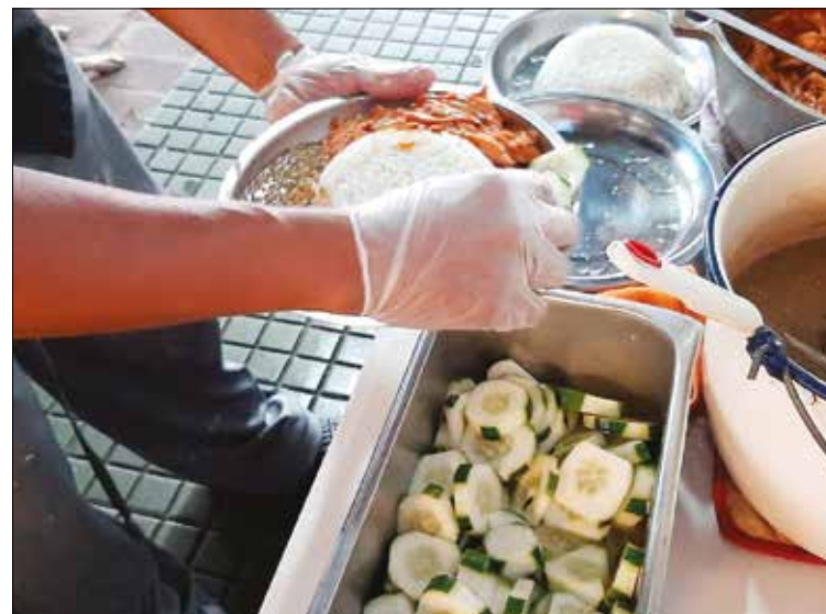
SIEMPRE HAY PAN. El buen corazón de los panameños hace posible que no falte el alimento.