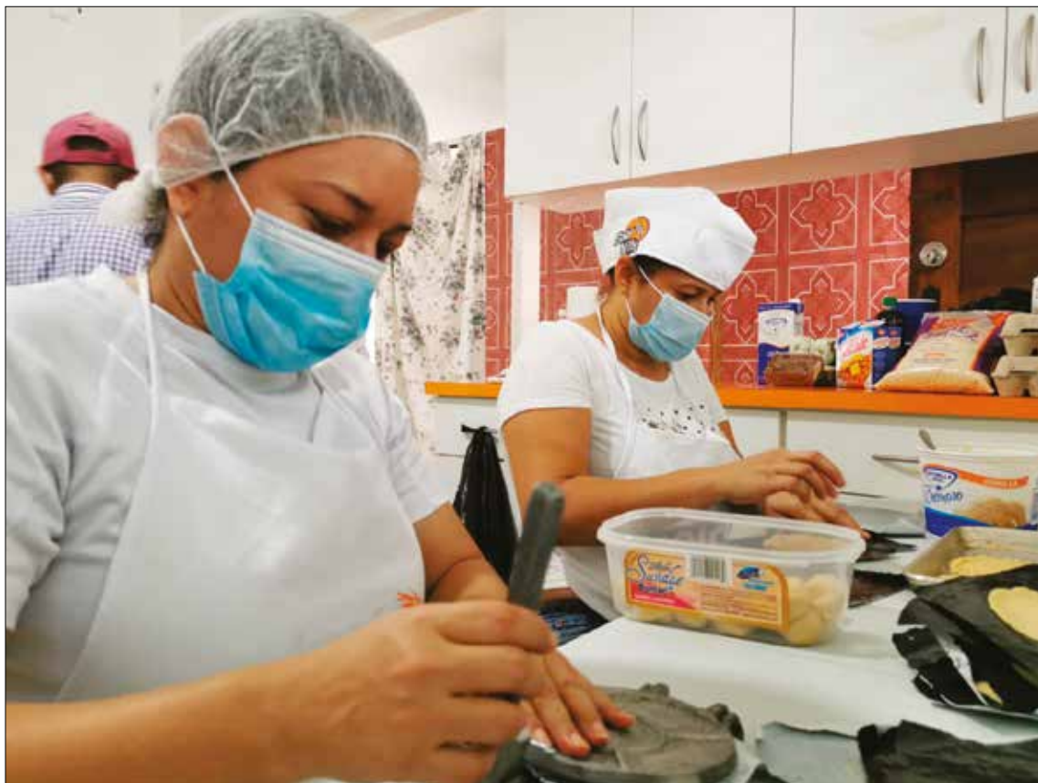
APOYO. Usan este espacio para hablar, aprender, reír, cantar y recordar con nostalgia a sus hijas que viven en Nicaragua.