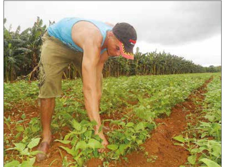
SIEMBRAS. Los campesinos siempre esperan mejorar y dar mejor vida a la familia.

En los comienzos del siglo XXI viene otra incursión en la región, que traería el desarrollo ilusionante a la población. Las hidroeléctricas, por supuesto, dieron trabajo mientras se hicieron y algún beneficio momentáneo, pero las consecuencias nefastas sobre el medio ambiente y la salud de las personas o sobre la fa-