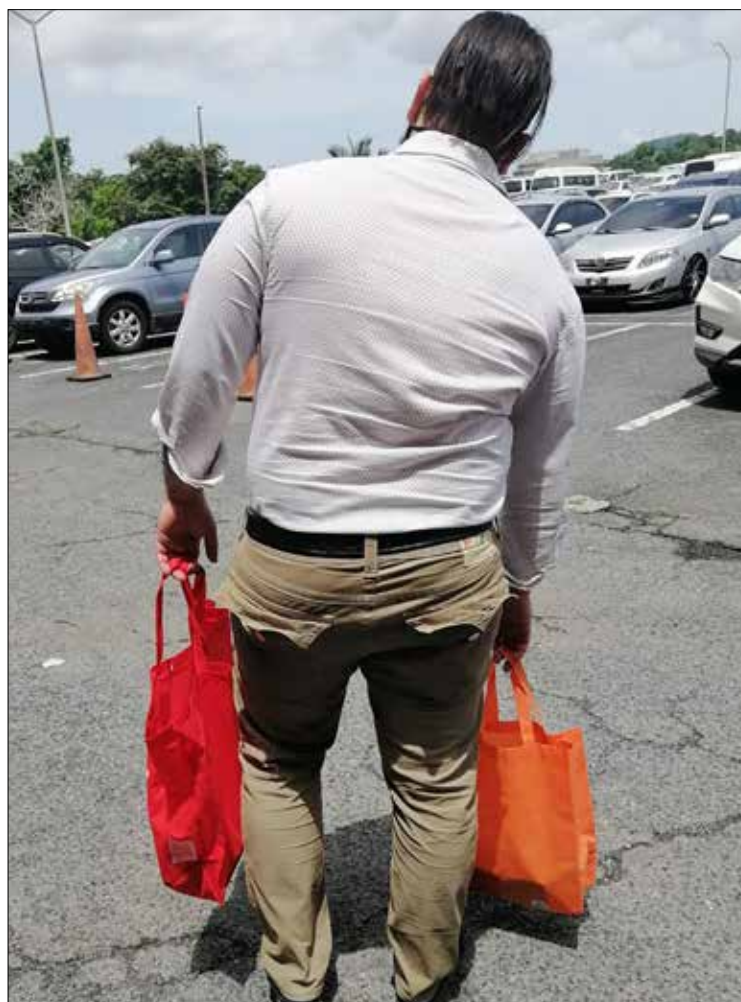
ERROR. Recargar los productos empacados, en el brazo dominante.

El peso puede ir con el tiempo desviando la columna y provocar escoliosis.