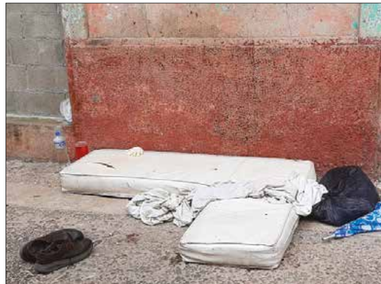
PASADO. Atrás quedan los colchones a la intemperie y la soledad.

Llegan y llaman. Casi siempre llorando porque sus niños no tienen qué comer. Por pura providencia, en el lugar encuentran consuelo y alimento. No se sabe cómo se multiplican las viandas. Solo pueden decir que es por pura Misericordia de Dios.