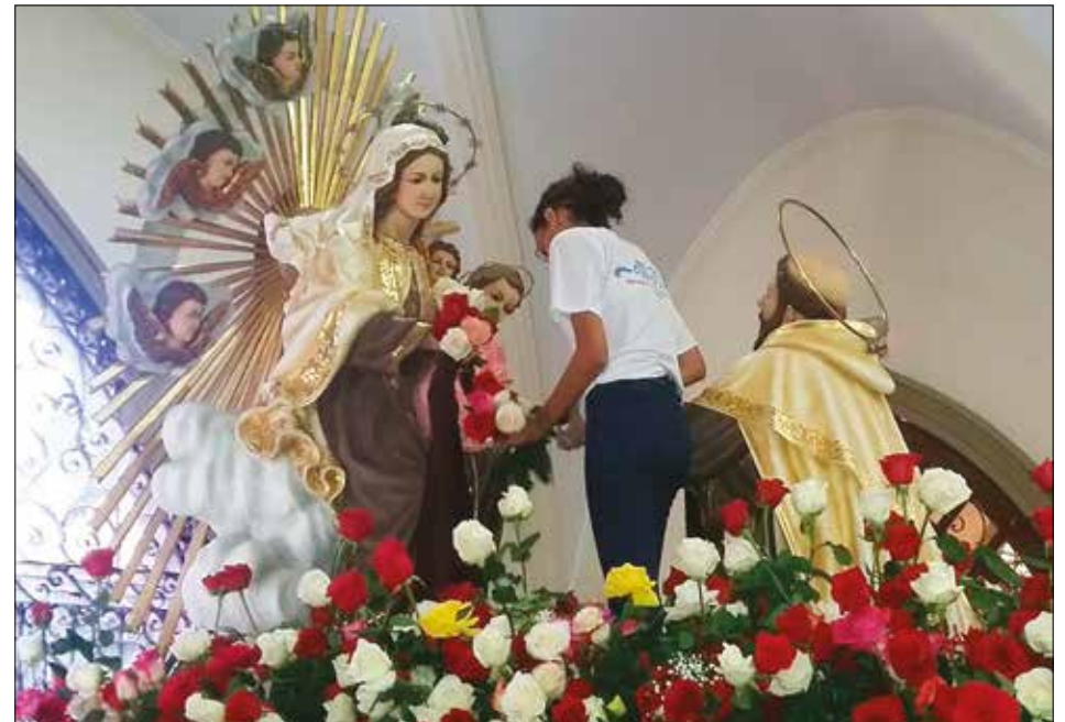
ORACIÓN. Pidamos a Dios, bajo la intercesión de María del Carmelo, por nuestras necesidades.

Los siervos de los feudales lucían un escapulario que identificaba a qué Señor pertenecían. Pero como los carmelitas no tenían “dueño”, usaron uno de color marrón de lana de oveja. Pero ya en 1251, la Virgen María se le apareció, con muchos