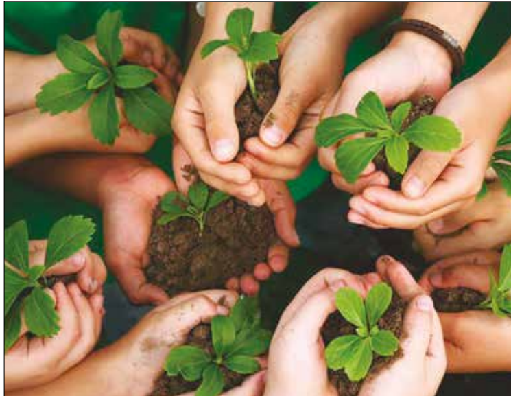
ACCIÓN. Se necesita una verdadera conversión ecológica, que nos lleve a un cambio sistémico.

una ínfima parte de los costes, y con ello se lavan las manos, o más bien sus conciencias.