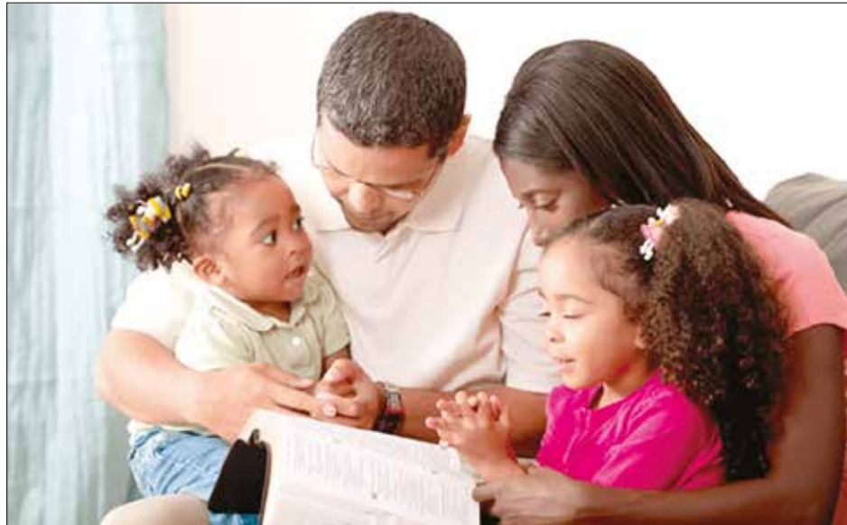
FAMILIA. Vivir y transmitir la fe a sus hijos.

La catequesis debe hablar de las cuestiones científicas porque la fe y la ciencia son complementarias, no enemigas. Por eso no