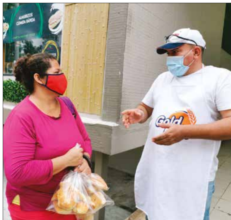
NECESIDAD. Desde Veranillo hasta Vía Argentina recorrió para buscar sus bolsas de pan.