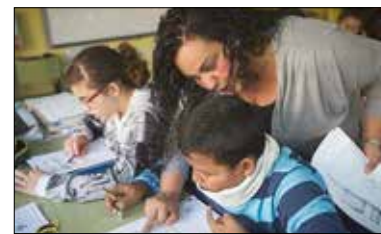
PERIFERIAS. Particular atención.

Scholas Social tiende puentes entre escuelas y organizaciones educativas de todo el mundo, con particular atención a las periferias. Busca cambiar y concienciar sobre la concepción de la educación y retomar su valor como eje transformador de la sociedad.