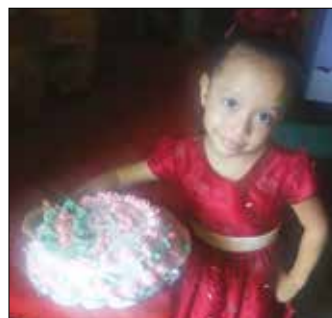
DULCE. Para los preferidos de Dios.