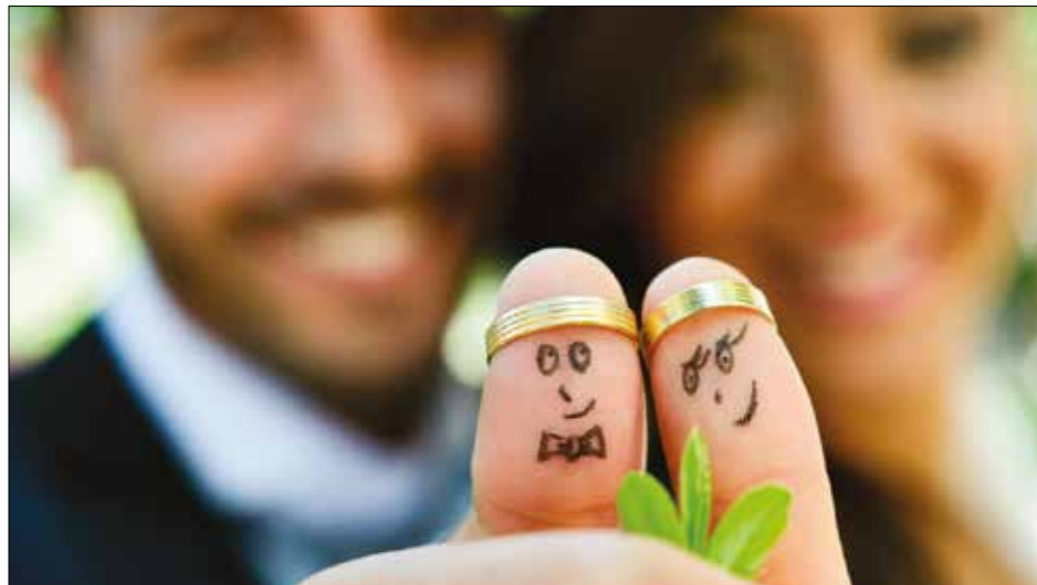
MATRIMONIO. Cada uno debe mantener viva la llama del amor con valentía.

Hoy en día, los matrimonios tienen la responsabilidad de mostrar que vivir en pareja