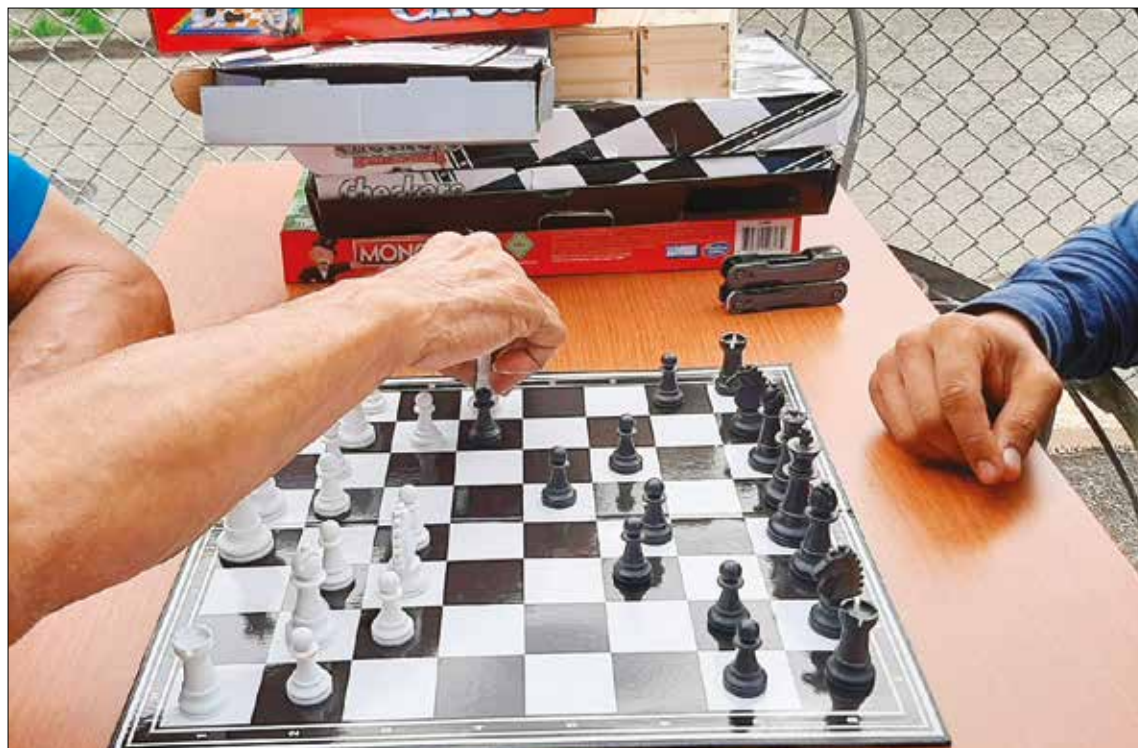
INTEGRAL. Durante el día se realizan diversas actividades que le devuelven las ganas de vivir dignamente a estas personas.

Han sido estas obras las que han “sacado la cara” en estos tiempos difíciles, que viven el mundo y el país de los panameños.