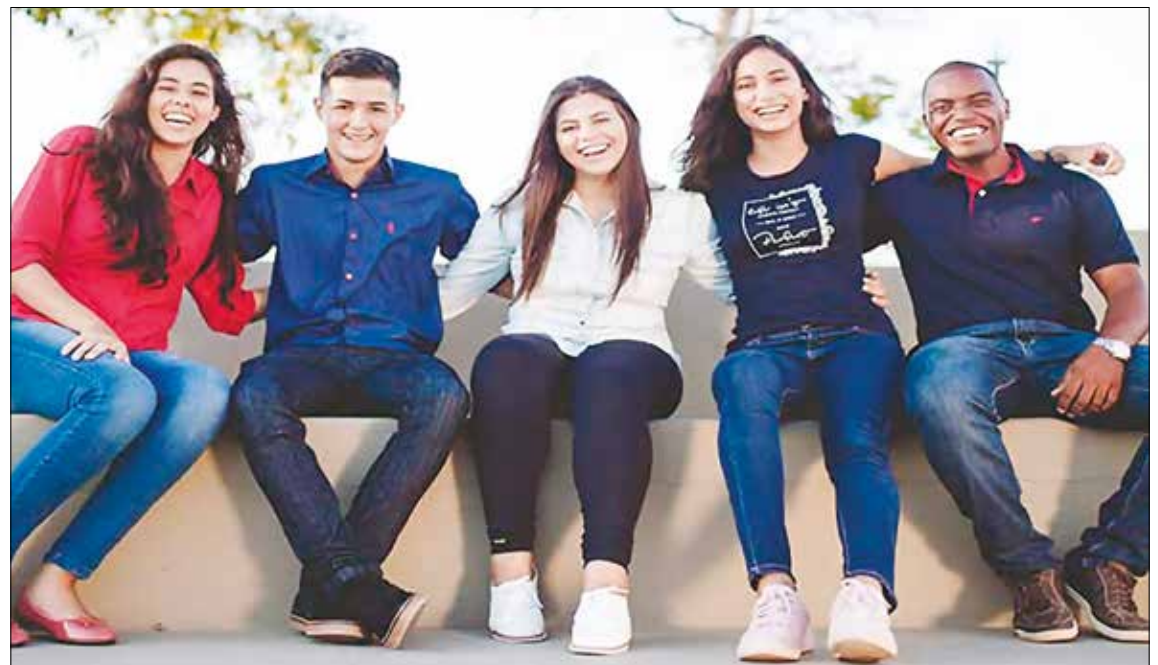
DISCÍPULOS. Los que responden al llamado profundizan y radicalizan su consagración a Dios.

Específica: En Iglesia existen tres vocaciones específicas: vocación laical, vocación al ministerio ordenado y vocación religiosa. Todas las vocaciones específicas son expresión del mismo Jesús. Ellas muestran, con sus formas de vida, lo particular y fecundo de cada camino a la comunidad cristiana. To-