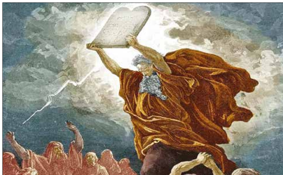
LEY. Cada mandamiento promueve valores, un aspecto de la experiencia humana.

Este peligro radica en un modo de ver las normas morales cristianas como si se tratase de leyes hechas por los hombres. Hay normativas que indican qué impuestos pagar, cómo moverse en las carreteras y