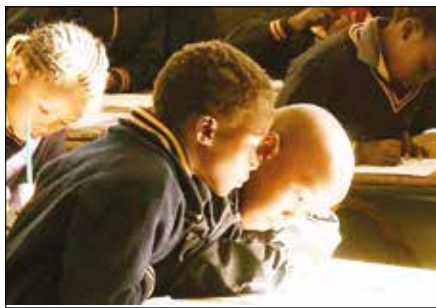
GRAVE. Crisis financiera de colegios.

ACIPRENSA. Arzobispo de Nueva York, Cardenal Timothy Dolan, informó que debido a la grave crisis financiera generada por la pandemia del coronavirus, 20 colegios católicos de la Arquidiócesis no volverán a abrir.