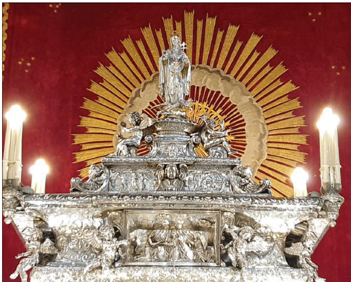
Urna con las reliquias de santa Rosalía

Roma, desde San Juan de Letrán, 29 de junio de 2024 Solemnidad de los santos Pedro y Pablo, apóstoles